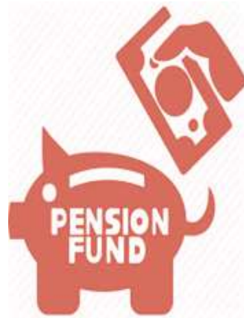
Хувийн тэтгэврийн сан