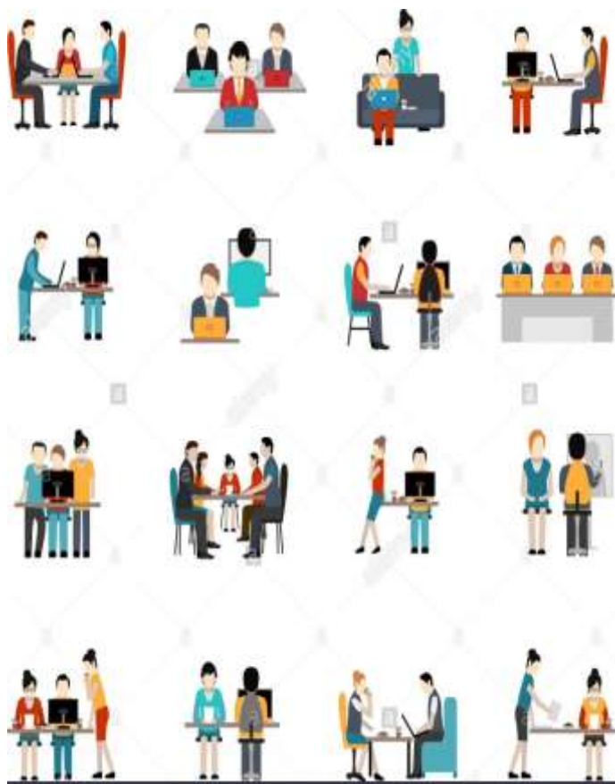
Co- Working space