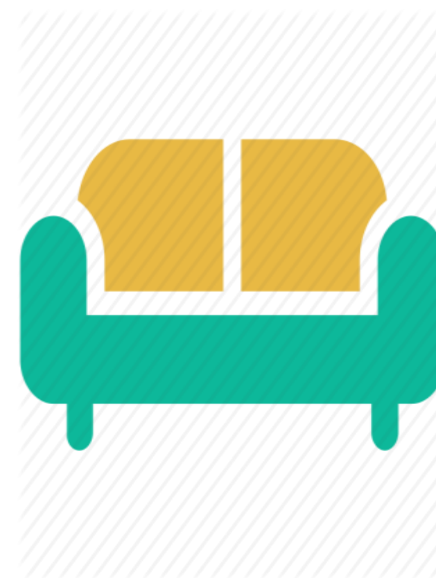
Амралты н орчин