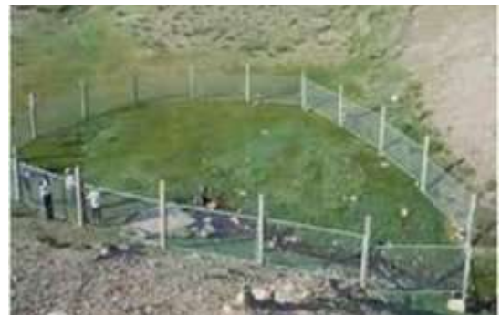
Булаг, шандны эхийг хамгаалах, дахин тохижуулах