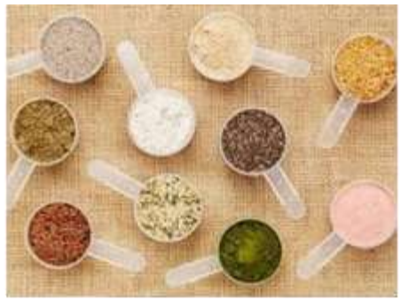
Уургийн агууламж бүхий нэмэлт тэжээл бэлтгэх, нийлүүлэх

Зайнаас тандах хэрэгсэл буюу хүзүүвч суурилуулалт