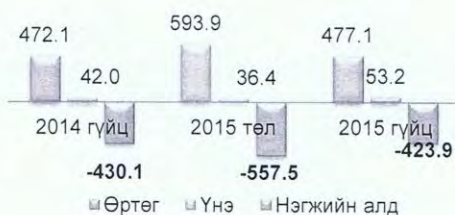
ЦЭХ-ний нэгжийн алдагдал /төг.мөн/